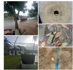
Imagem do Sítio Ruínas do Engenho Santana